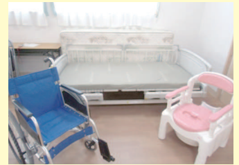
演習器材例 (ベッド、車いす、ポータブルトイレ)