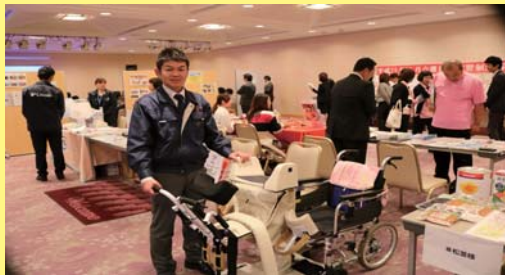
【海外人材紹介ブース】

ウェルグループパートナー各企業様によるヘルスケア商品の展示や、技能実習生の取り組み紹介、(一社)全国メディケア・海外事業協議会紹介